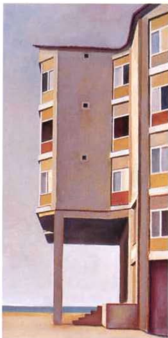
viator óleo/madera 80 x 40 cms.

Si algo puede atestiguar en esta tierra la existencia de un poder divino, es la luz; y un instinto remoto lleva al hombre a reconocer por ella esa divinidad posible, aunque el fundamental sosiego que la luz difunde traiga consigo angustia fundamental equivalente, ya que en definitiva la muerte aparece entonces como la privación de la luz. LUIS CERNUDA