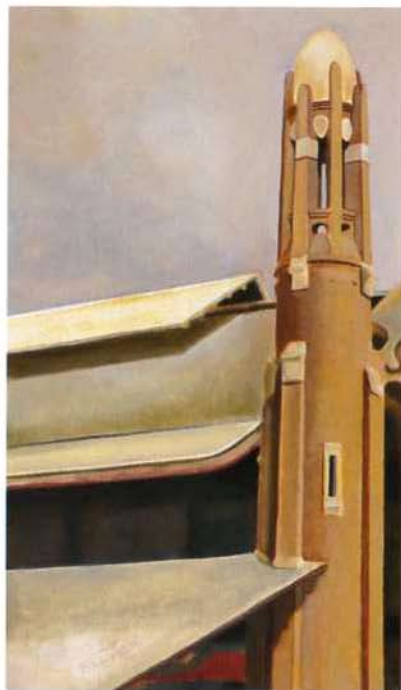
mercado colón óleo/madera 60 x 35 cms.