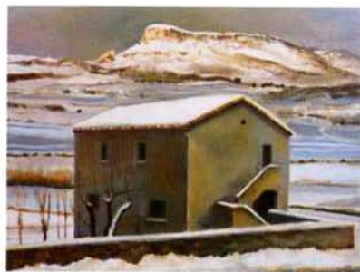
casa tartarugha óleo/madera 30 x 40 cms.

Maldigo el grano de arena que nos separa y el laúd de los jilgueros llamando a mi puerta. Se extingue la noche pero no su deber, en el sepulcro de mi cuarto todo es símbolo. Moviéndose así, casi sin luz, desayuno en sombras mientras se enfría eternamente el te espero en la hondura de mi cuarto, espejo o río. RAUL EGUIZABAL