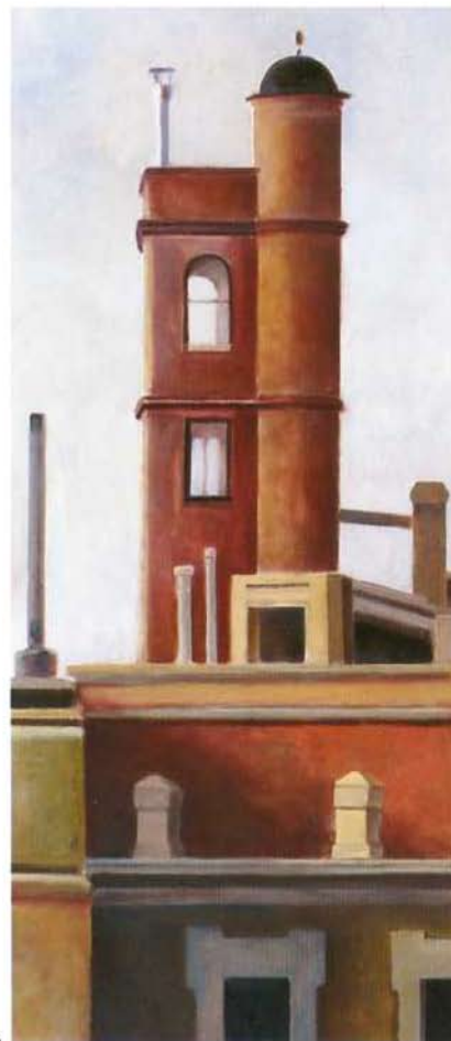
la casa roja óleo/madera 70 x 30 cms.