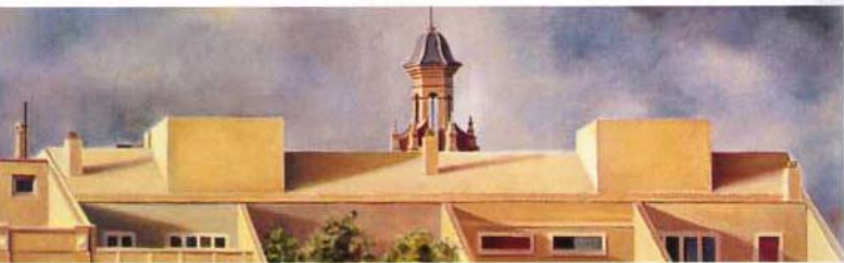
terrazas de valencia óleo/madera 30 x 100 cms.

«Cuando yo guiaba por sus calles, no mostraba tal o cual monumento, sino un rincón, determinada hora en determinado sitio, un temblor del alma entre la humanidad de alrededor que no iba a ningún sitio, sino que estaba ya, que vivía, que rezumaba su modesta felicidad.» RAMÓN GÓMEZ DE LA SERNA