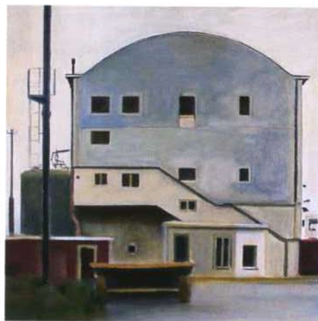
puerto de nápoles óleo/madera 30 x 30 cms.

Los detalles infunden calma y serenidad, no sólo por su sencillez inesperada, sino también porque, aunque nada más sea durante el segundo en que se los observa de pasada, suspenden momentáneamente el curso de los acontecimientos. La contemplación de los detalles dilata el tiempo, lo remansa, fragmentándolo en instantes que lo diversifican y enriquecen. J. MUÑOZ MILLANES