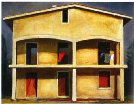
casa paola óleo/madera 30 x 40 cms.

Estoy dispuesto a amar a muchas. Puras e impuras. Virtuosas y prostitutas. Espontáneas y sofisticadas. Desnudas y engalanadas. Proleterías y burguesas. ¡Con tal de que estén vivas! ¡Me horrorizan las momias y las resucitadas! Dejemos a Frankenstein con su novia... JEAN NOUVEL