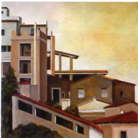
taormina óleo/madera 40 x 40 cms.

Los detalles infunden calma y serenidad, no sólo por su sencillez inesperada, sino también porque, aunque nada más sea durante el segundo en que se los observa de pasada, suspenden momentáneamente el curso de los acontecimientos. La contemplación de los detalles dilata el tiempo, lo remansa, fragmentándolo en instantes que lo diversifican y enriquecen. J. MUÑOZ MILLANES