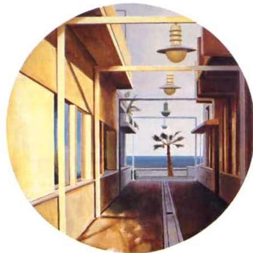
malvarosa óleo/madera 50 cms. Ø

Las casas de Venecia son unos inmuebles con nostalgia de barco: de ahí sus plantas bajas a menudo inundadas. Satisfacen el deseo de un domicilio estable y del nomadismo. PAUL MORAND