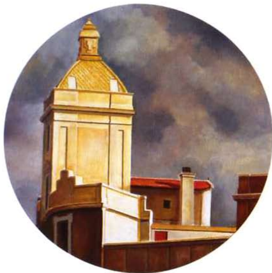
valencia óleo/madera 75 cms. Ø

Hay ciudades a las que jamás se vuelve. El sol se estrella en sus ventanas, como espejos. No llega nunca a atravesarlas, ni por todo el oro del mundo. En todas ellas hay, sobre el río, seis puentes. En todas ellas hay lugares donde pusiste tus labios en otros labios, tu pluma en el papel. Y algún aturdimiento de columnas, de estatuas o de arcadas. Las multitudes toman el tranvía, charlando en la lengua de un hombre que ya no está. JOSEPH BRODSKY