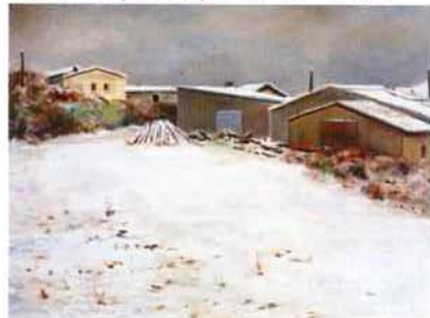
nieve en campezo óleo/madera 30 x 40 cms.

Maldigo el grano de arena que nos separa y el laúd de los jilgueros llamando a mi puerta. Se extingue la noche pero no su deber, en el sepulcro de mi cuarto todo es símbolo. Moviéndose así, casi sin luz, desayuno en sombras mientras se enfría eternamente el te espero en la hondura de mi cuarto, espejo o río. RAUL EGUIZABAL