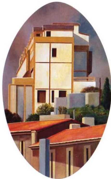
el antiguo óleo/madera 80 x 50 cms.