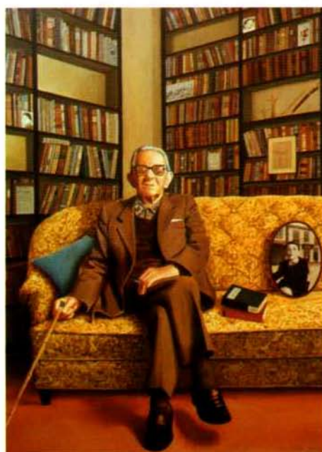
Retrato de Gonzalo Torrente Ballester. 130 x 97 cm. 2000