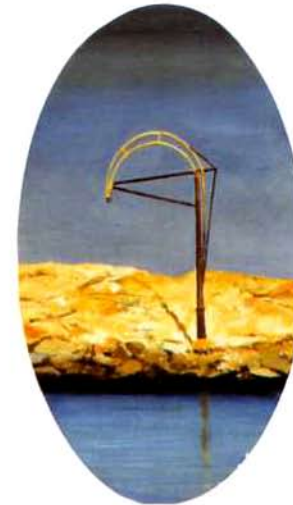
Artefacto. 49 x 28 cm. óleo/madera. 1995