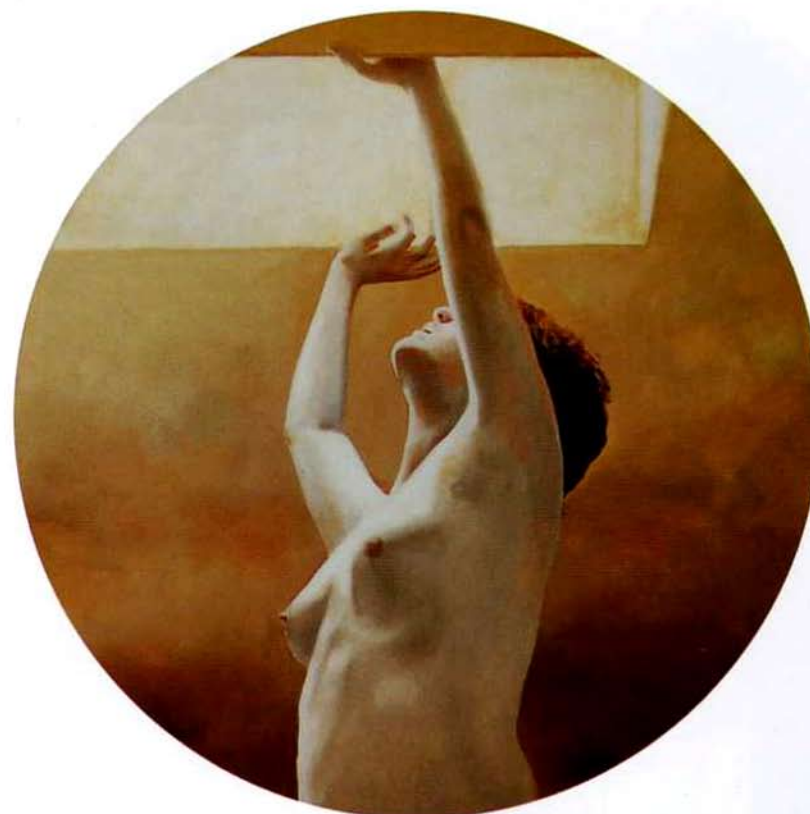
Desnudo del vacío I. 50 cms. diámetro. Óleo sobre madera. 2001