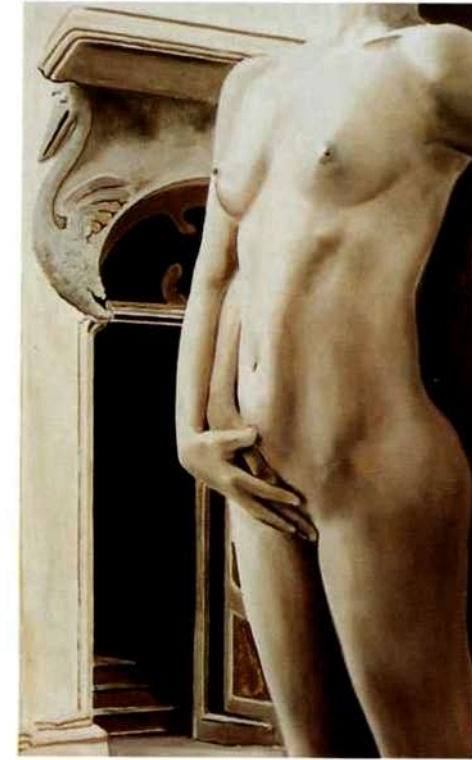
Desnuda en la Habana I. 41 x 25 cms. Óleo sobre madera. 2000