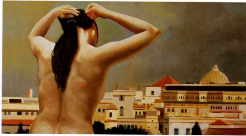
Desnuda en la Habana IV. 25 x 41 cms. Óleo sobre madera. 2000