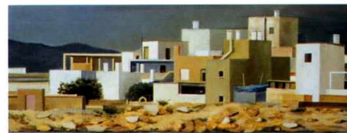
Aguilas. 36 x 93 cm. óleo/madera . 1995