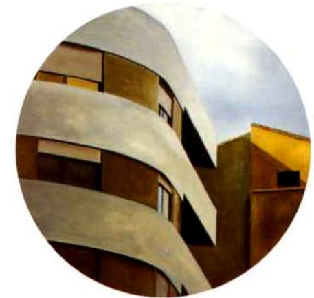
La Esquina doblada. 48 cm. ø. óleo/madera. 1995