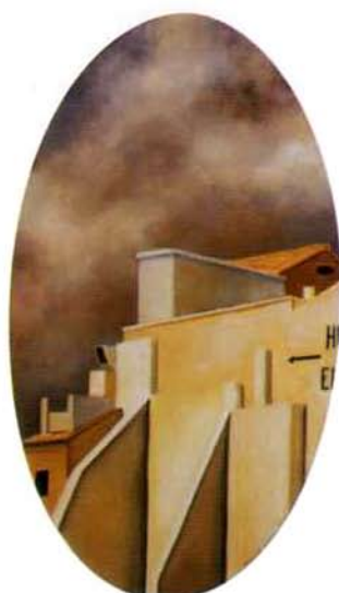
Hotel. 49 x 29 cm. óleo/madera. 1999