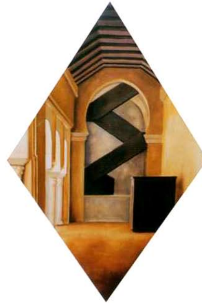
Desde el patio de los naranjos. 90 x 60 cm. óleo/madera. 1999