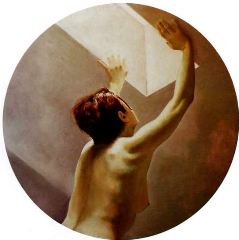
Desnudo del vacío II. 50 cms. diámetro. Óleo sobre madera. 2001