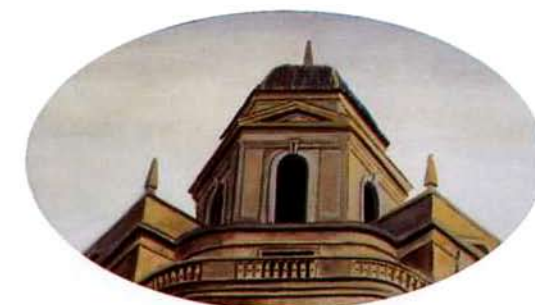
Valencia. 28 x 49 cm. óleo/madera. 1995