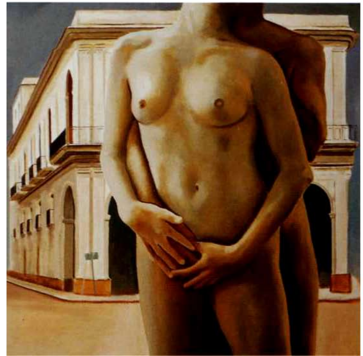
Desnuda en la Habana II. 39 x 39 cms. Óleo sobre madera. 2000