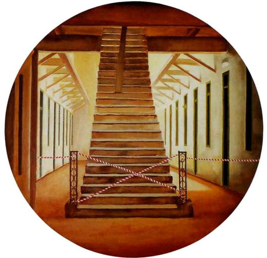
Escalera. 75 cms. diámetro. Óleo sobre madera. 2001