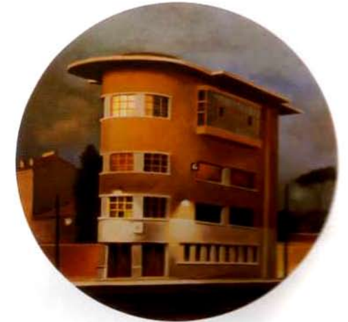
Stazione. 75 cm. ø. óleo/madera. 1999