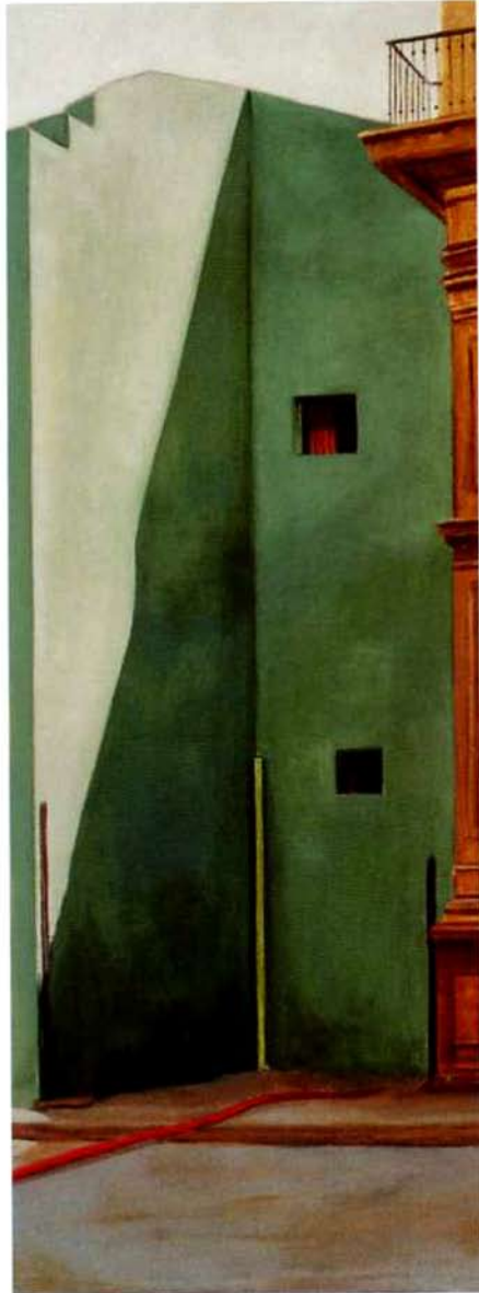
Rincón. 92 x 35 cms. Óleo sobre lienzo. 2000