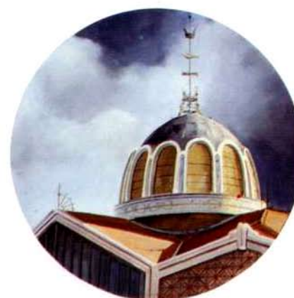
La Cupula. 48 cm. ø. óleo/madera. 1995