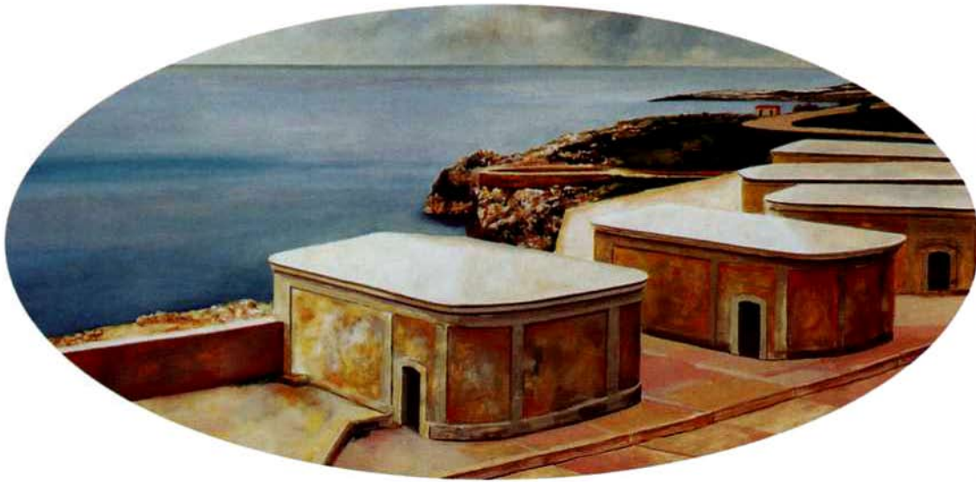
Fortaleza del morro. 75 x 100 cms. Óleo sobre madera. 2000