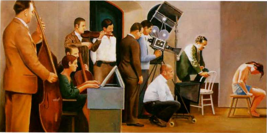
El rodaje de A. Óleo/tela. 73 x 146 cm. 2001