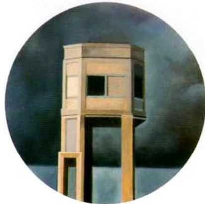
Torre vigia. 50 cm. ø. óleo/madera. 1999