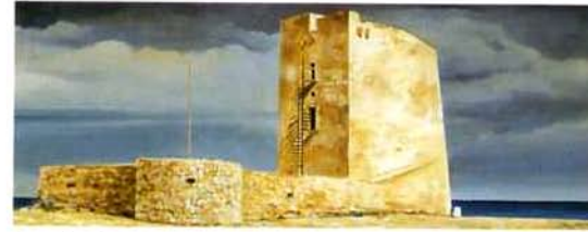
Castillo de Cabo Cope-Aguilas. 36 x 93 cm. óleo/madera. 1995