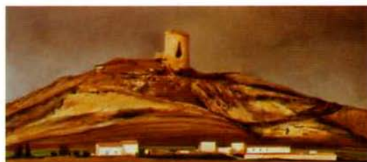
Castillo de Mota del Marques. 26 x 48 cm. óleo/madera. 2000