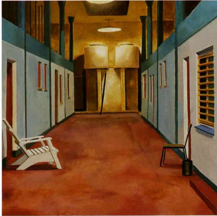
Interior. 60 x 60 cms. Óleo sobre madera. 2000