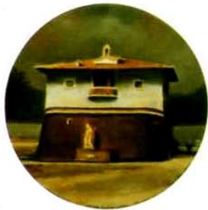
Casona. 25 cm. ø. óleo/tela. 1997