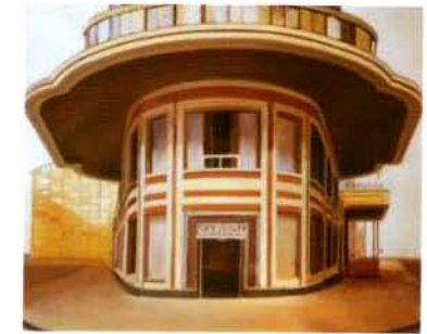
Capitol. 50 x 61 cm. óleo/tela. 1997