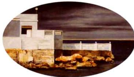
Las Rotas. 28 x 49 cm. óleo/madera. 1995