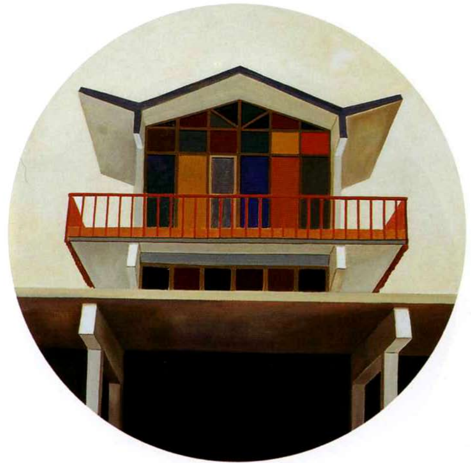
Bacuranao. 75 cms. diámetro. Óleo sobre madera. 2000