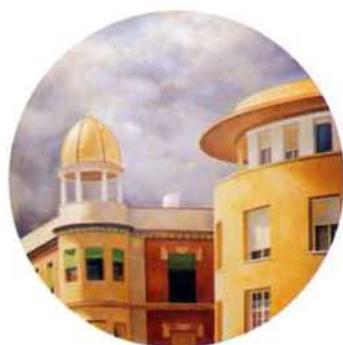
Diálogo I. 122 cm. ø. óleo/madera. 1999