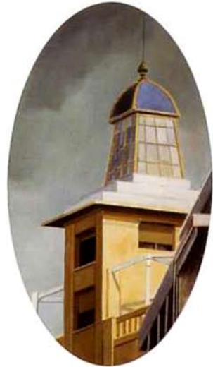
La casa cúbica. 49 x 28 cm. óleo/madera. 1995