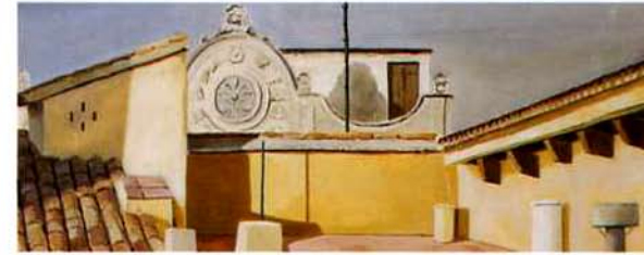
La Azotea. 25 x 81 cm. óleo/madera. 1995