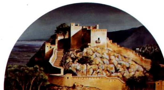
Castillo de Xativa. 58 x 109 cm. óleo/madera. 1995