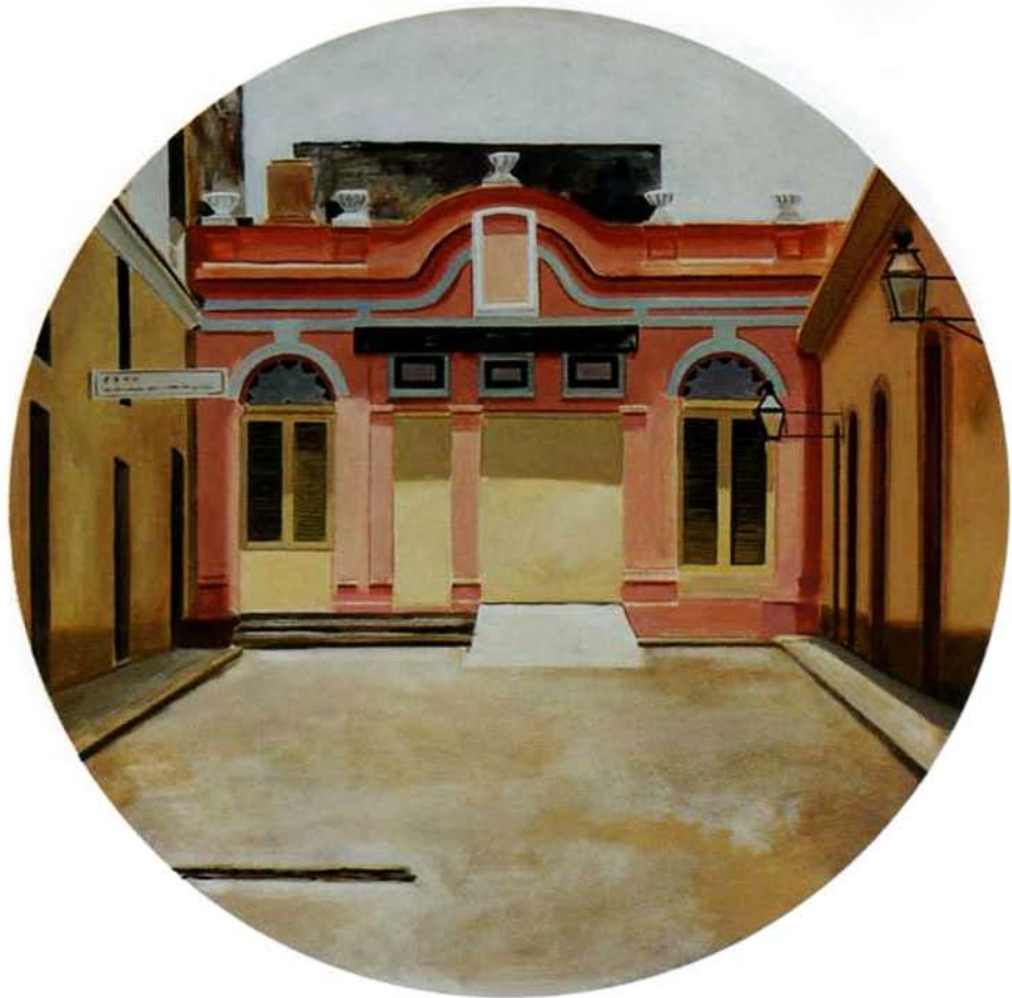
Casa Camao. 75 cms. diámetro. Óleo sobre madera. 2000