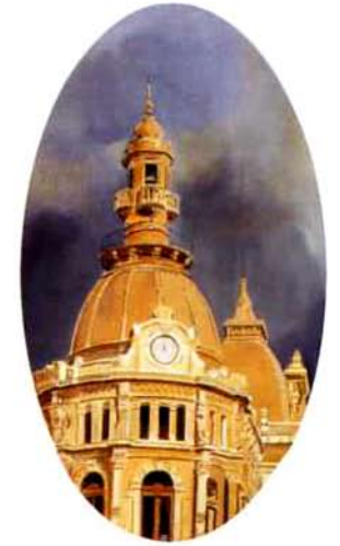
Cartagena. 49 x 28 cm. óleo/madera. 1995