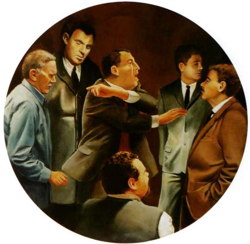
Desacuerdo, 50 cms. diámetro, Óleo sobre madera. 2000