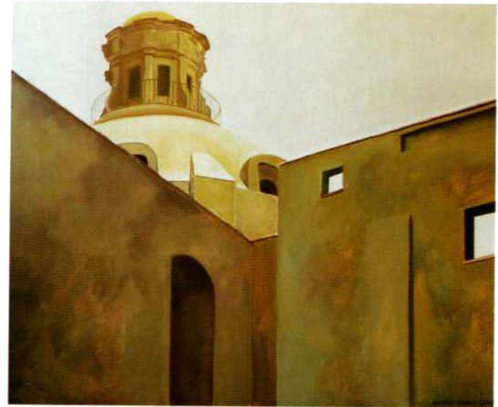
Cúpula. 43 x 52 cm. Óleo sobre madera. 2000