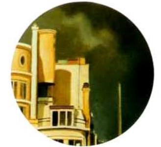
Londres. 25 cm. ø. óleo/tela. 1997