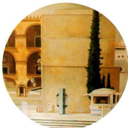
Diálogo II. 122 cm. ø. óleo/madera. 1999