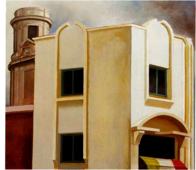
Italia. 39 x 43 cms. Óleo sobre madera. 2000