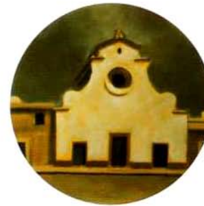
Iglesia de Santo Espiritu. 25 cm. ø. óleo/tela. 1997