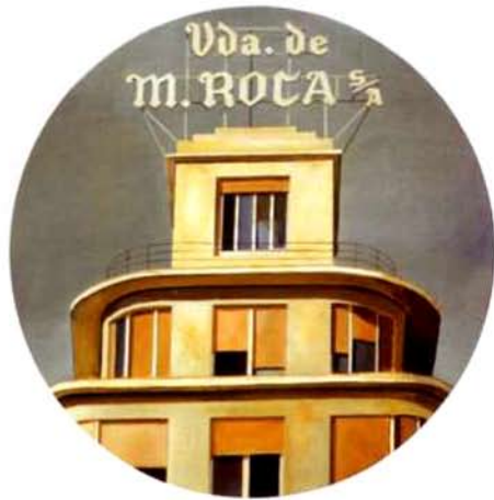
La casa de la viuda. 48 cm. ø. óleo/madera. 1995