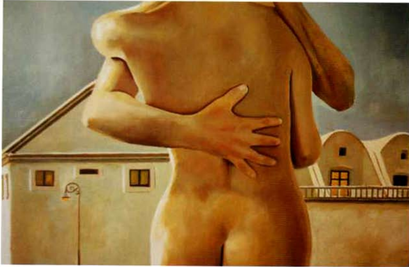
Desnuda en la Habana III. 27 x 41 cm. Óleo sobre lienzo. 2000