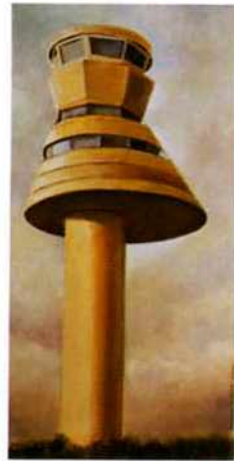
Torre Foronda. 40 x 20 cm. óleo/madera. 2000