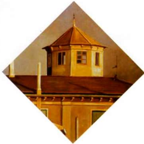
Casa en Paredes de Nava. 40 x 40 cm. óleo/madera. 2000