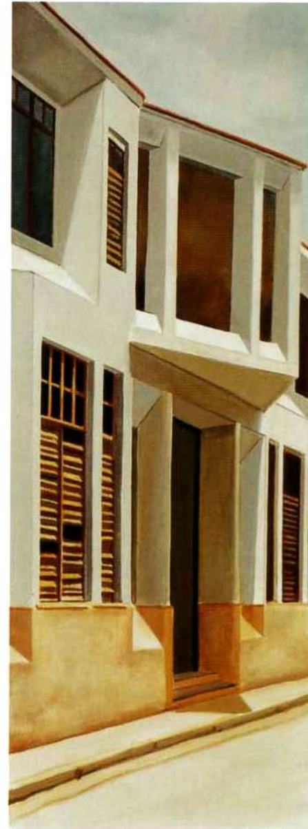
Casa Catay. 92 x 35 cms. Óleo sobre lienzo. 2000