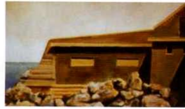
Bunker. 20 x 30 cm. óleo/madera. 2000