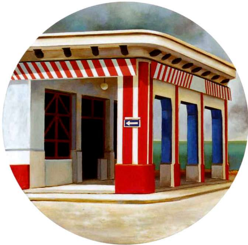
Paladar Alonso, 100 cms. diámetro. Óleo sobre madera. 2000