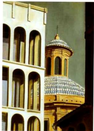
De Chirico en Valencia. 70 x 50 cm. óleo/tela. 1995