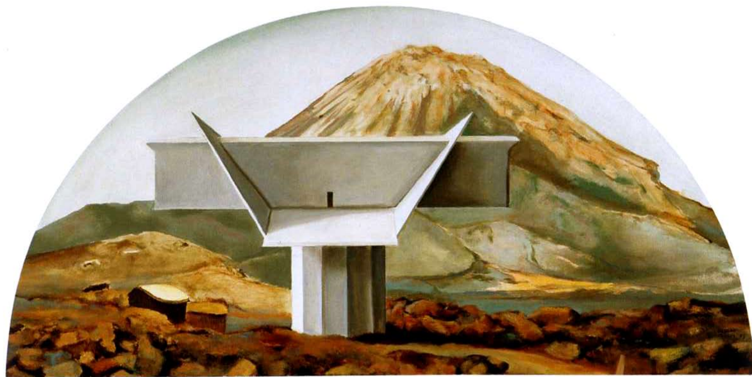
Mansion chã das Caldeiras. 37,5 x 75 cm. Óleo/Madera. 2004