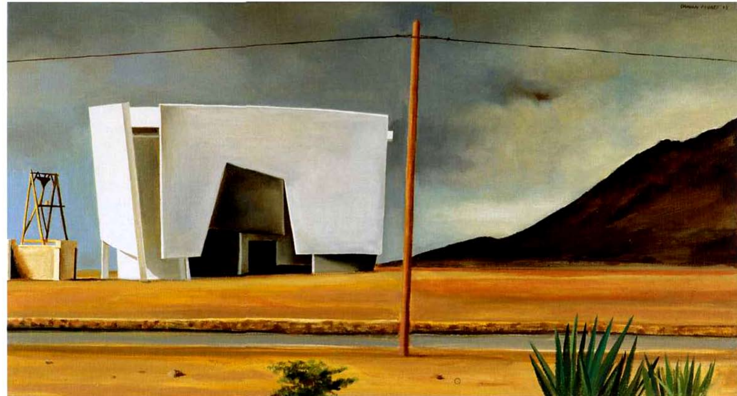
Casa Oteiza. 50 x 92 cm. Óleo/Madera. 2004