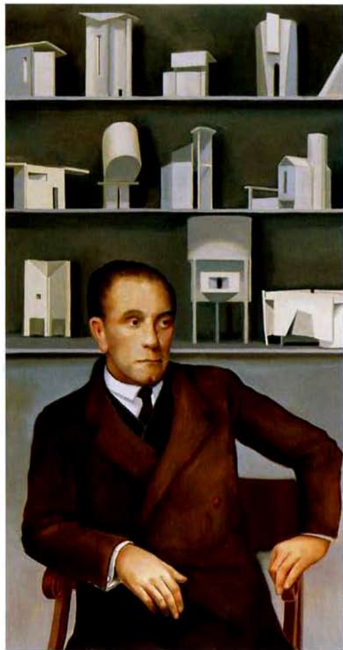
Adolf Loos. 114 x 60 cm. Óleo/Tela. 2004

¿En morada? ¿Realmente están destinados a ser habitados estos edificios de muros lisos y blancos, sin ornamentación, con escasas ventanas, silenciosos y solitarios?. Damián Flores se detiene en el deseo. Ha aprendido la lección de Loos quien escribió una fábula con moraleja, Acerca de un pobre hombre rico para el que un arquitecto diseñó una casa y, en ella, todo lo que pudiera desear. De modo que, una vez concluida, ya no quedaba espacio para nuevos deseos y se vio cortado del futuro, del vivir y aspirar .