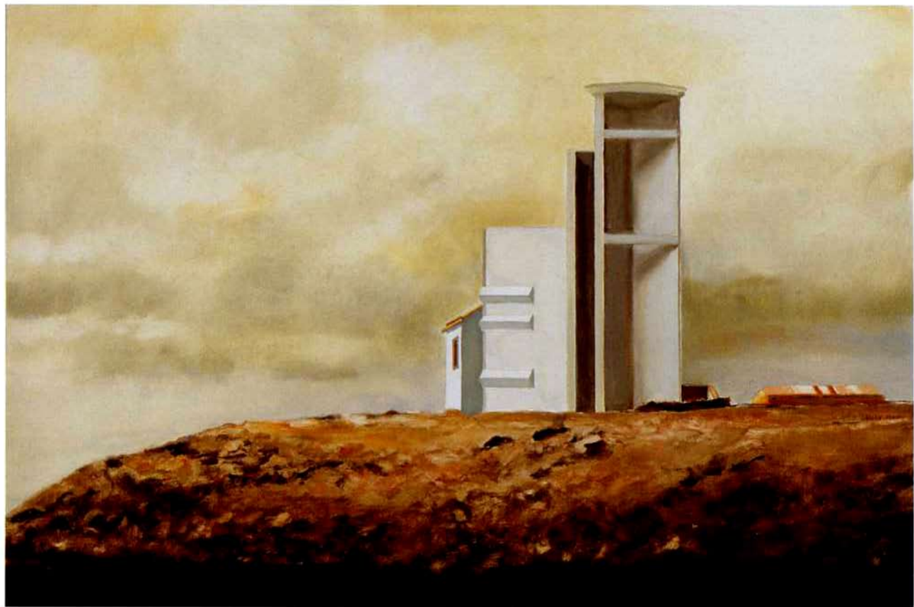
Mirador de Aguadinha. 39 x 58 cm. Óleo/Madera. 2004