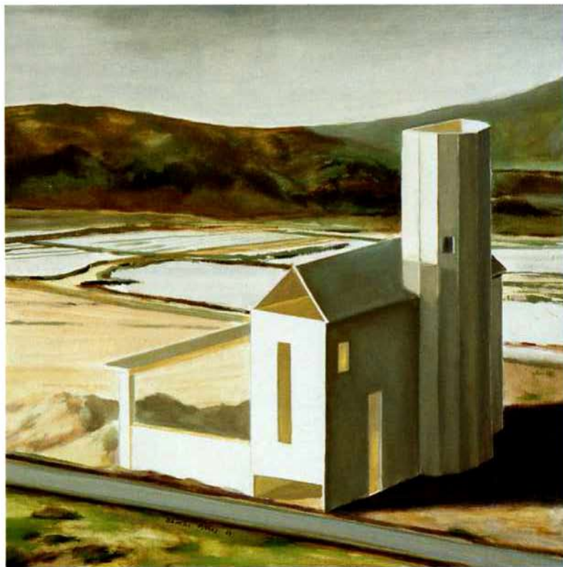
La casa del salinero. 40 x 40 cm. Óleo/Madera. 2004