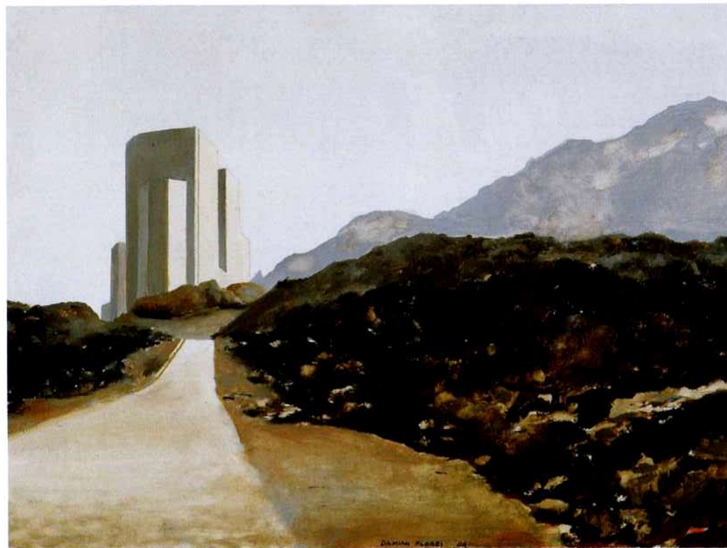
Camino Bordeira. 30 x 40 cm. Óleo/Madera. 2004