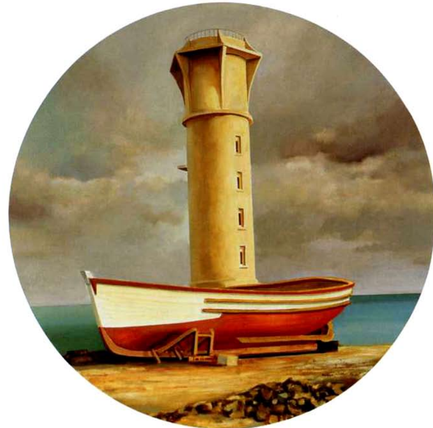
Faro de agua. 75 cm. diámetro Óleo/Madera. 2004