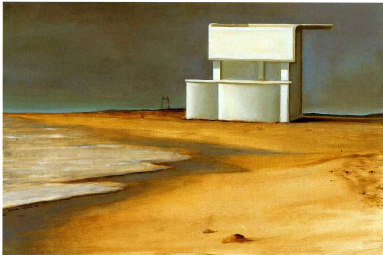
Casa da praia. 39 x 58 cm. Óleo/Madera. 2004