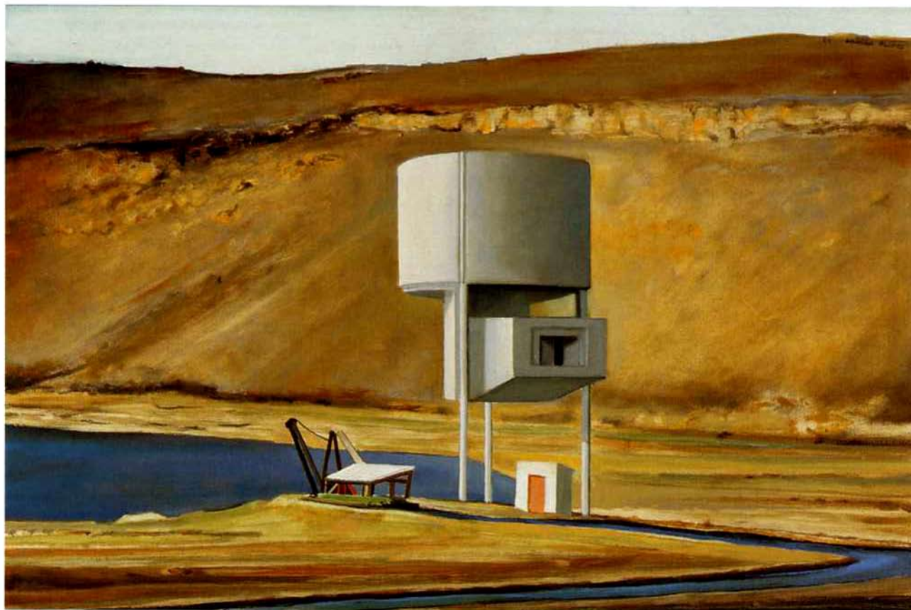
Salinas de Pedra Lume. 39 x 58 cm. Óleo/Madera. 2004