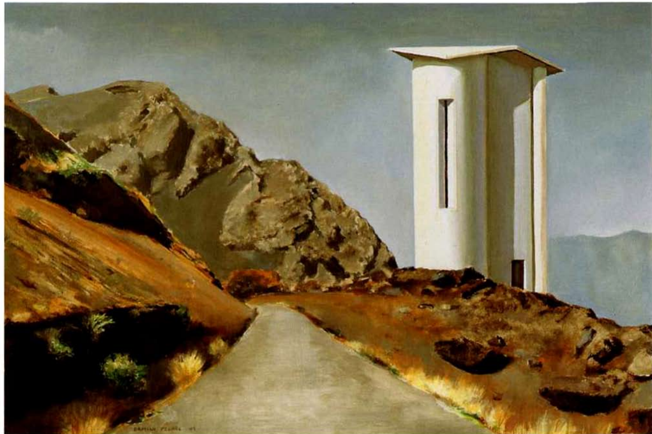
Pousada da luz. 39 x 58 cm. Óleo/Madera. 2004