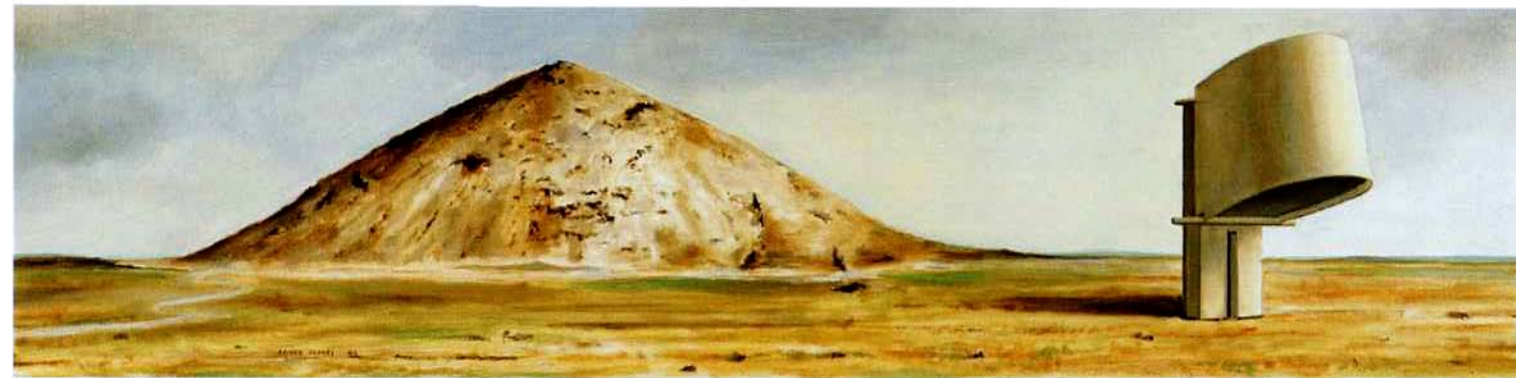
Álvaro Siza. 40 x 40 cm. Óleo/Madera. 2004

En sus maquetas /edificios/ paisajes busca, siempre, una armonía entre la construcción y el espacio. Se trata de no suplantar a la naturaleza: Lo que la naturaleza da, no precisa ser hecho . La máxima es de Siza al que retrata rodeado de los cuadros de esta exposición. No existe competencia entre las formas materiales y los deseos y construcciones del hombre. El resultado es una armonía que da sentido y realidad a los paisajes pintados.