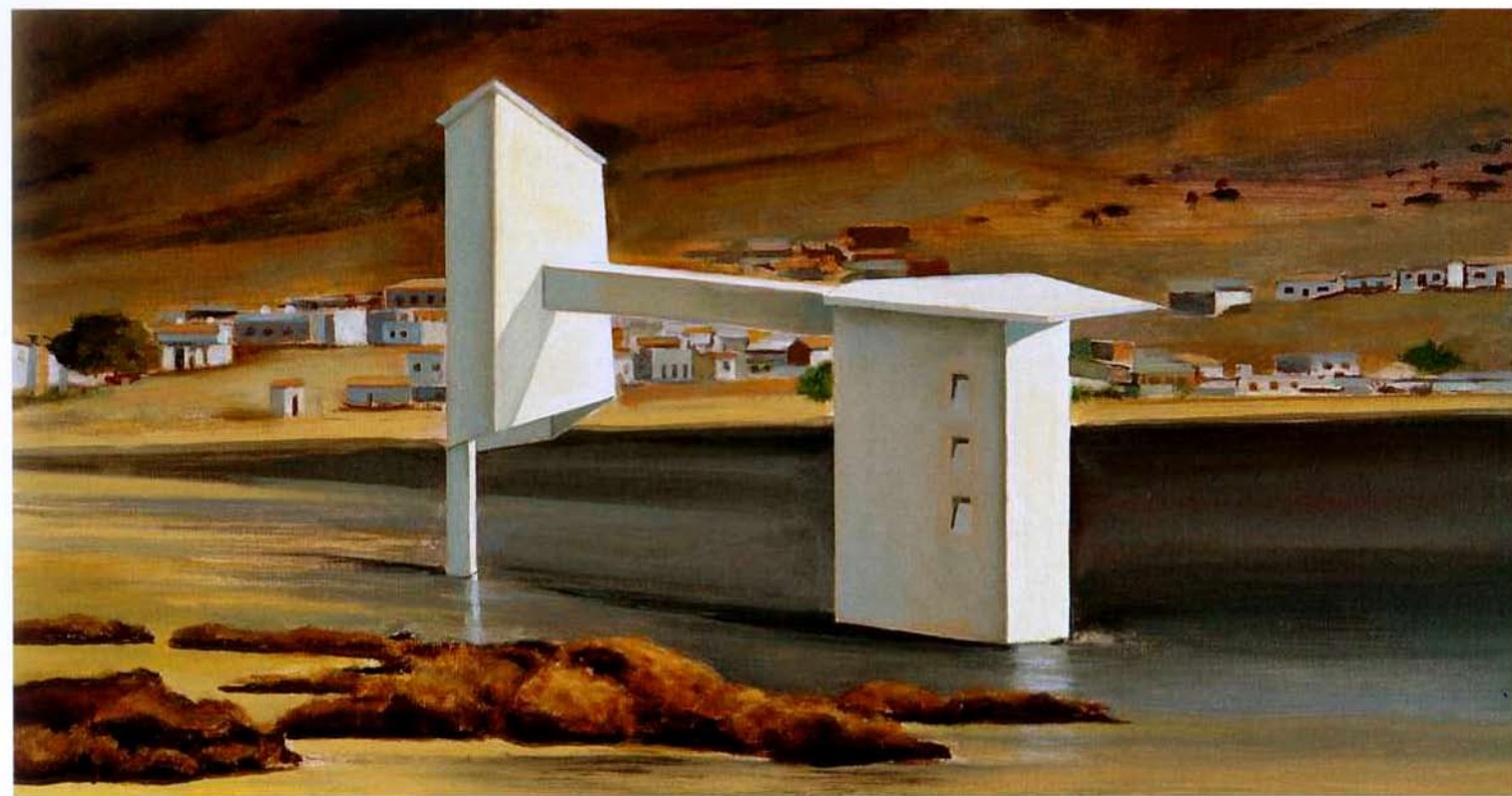
Mansion Morabeza. 29 x 55 cm. Óleo/Madera. 2004