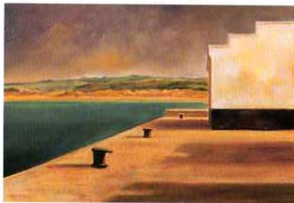
Desde el puerto. 1998. Óleo sobre lienzo. 55 x 38 cm.