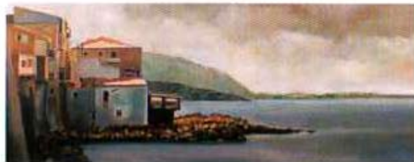
Mar de Cefalù. 1998. Óleo sobre madera. 40 x 100 cm.