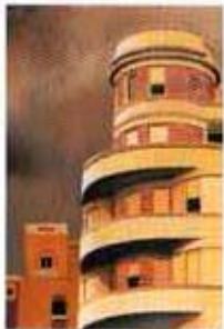
Siboney, 1998. Óleo sobre madera. 56 x 38 cm