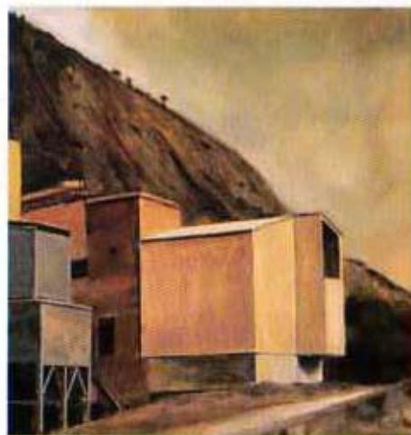
Fábrica. 1998. Óleo sobre madera. 42 x 39 cm.