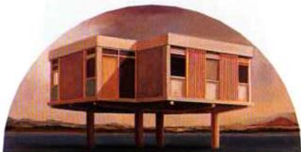
Casa Berria. 1998. Óleo sobre madera. 50 x 100 cm.