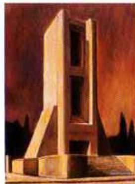
Monumento. 1997. Óleo sobre madera, 35 x 25 cm.