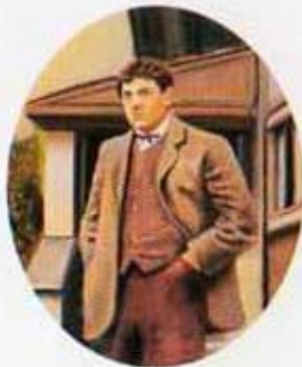
George Braque en Mendezueta. 1996. Óleo sobre madera. 30 x 25 cm.