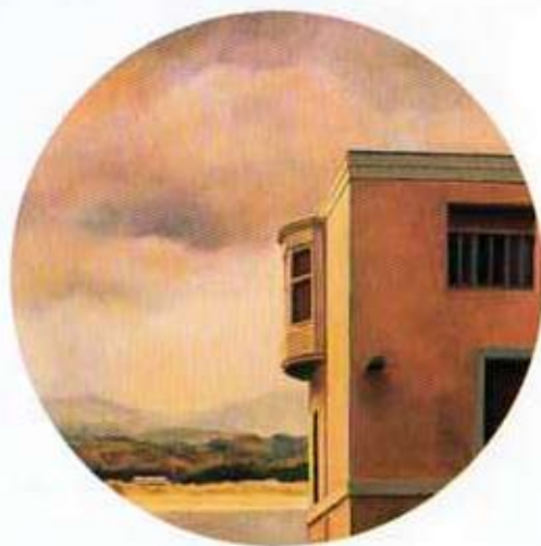
Casa de la Rosa. 1998. Óleo sobre madera. 48 cm ø