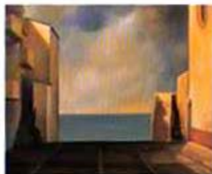
Cetalú, 1998. Óleo sobre madera, 46 x 55 cm.