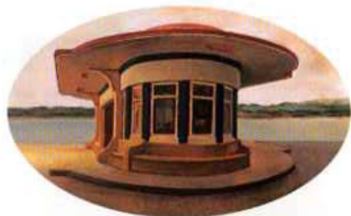
Estación de San Martín. 1998. Óleo sobre madera, 50 x 80 cm.