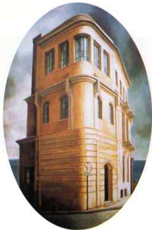
Casa Sciascia. 1998. Óleo sobre madera. 170 x 116 cm.