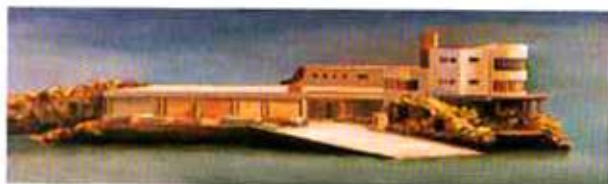
Isla de los Ratones, 1998. Óleo sobre madera, 30 x 100 cm.