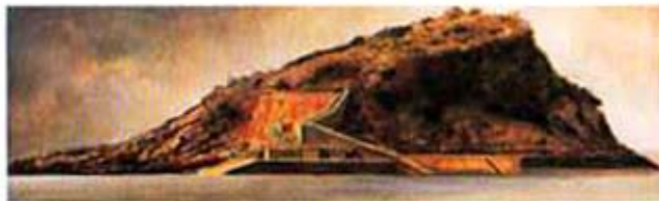
Isla de Santa Clara, 1998. Óleo sobre madera, 30 x 110 cm.